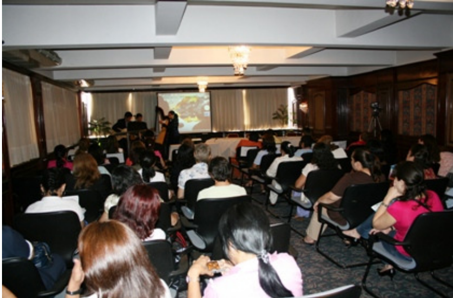
Fotografía 5: Auditorio General