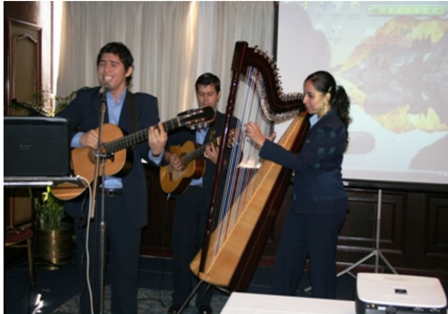
Fotografía 3: Momento Artístico. CoNjunto Musical de la Facultad Politécnica de la Universidad Nacional de Asunción