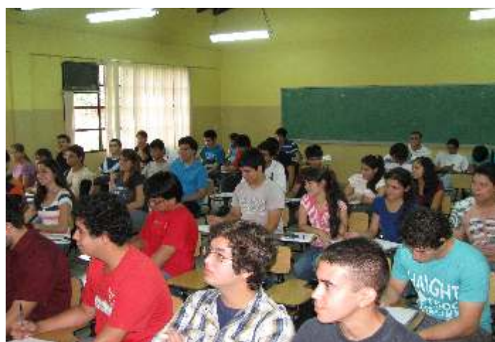
Instantánea de alumnos durante el desarrollo de clases correspondientes al primer periodo académico de la FP-UNA.