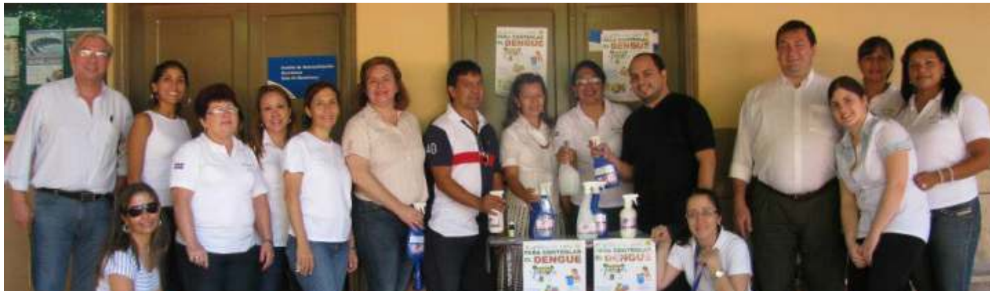
Equipo de funcionarios y de profesores unidos en la lucha contra el Dengue.

Nota: María Elena Torres, División Prensa - 22/02/2013