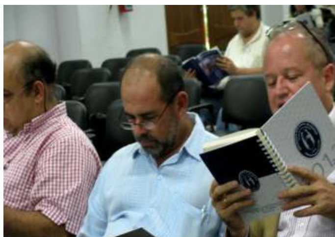
Profesores observando la nueva agenda 2013 de la FP-UNA.