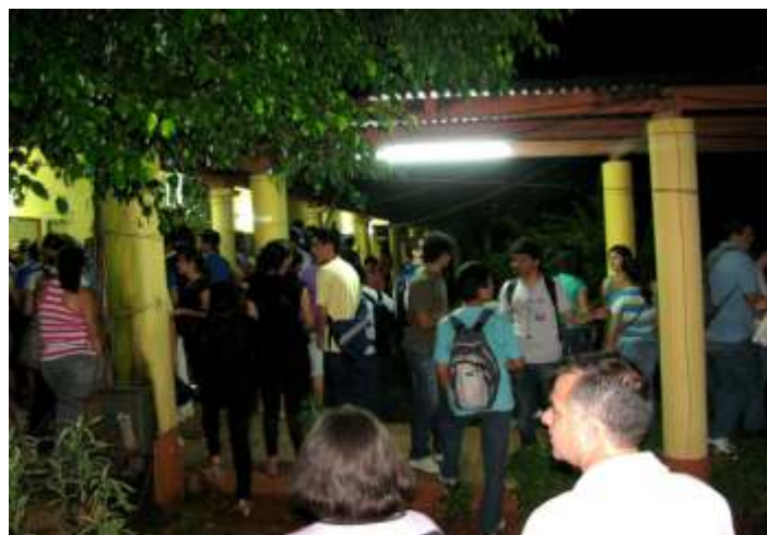
Momento en que los estudiantes se aproximan al sector del Cursillo para observar el resultado de los exámenes.