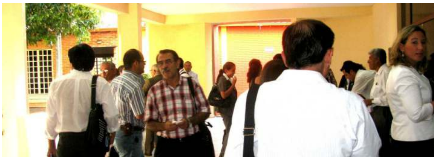
Instantánea de la llegada de profesores a la entrada del Aula Magna de la FP-UNA.