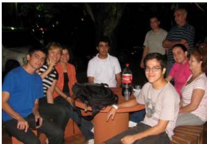
Jóvenes a la espera de los resultados de los exámenes de admisión en compañía de familiares y amigos.

Para todos ellos congratulaciones y éxitos en esta nueva etapa de sus vidas donde el esfuerzo, la perseverancia y la responsabilidad serán los ingredientes indispensables para el logro del tan ansiado título universitario de la UNA.