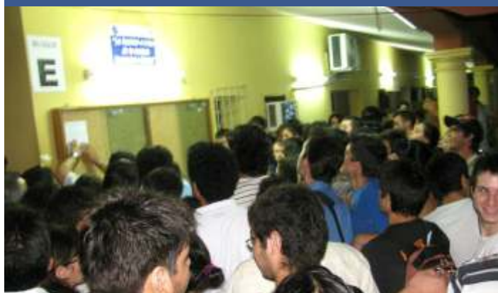
Aglomeración de los ansiosos jóvenes durante la exposición de las planillas de ingresantes.