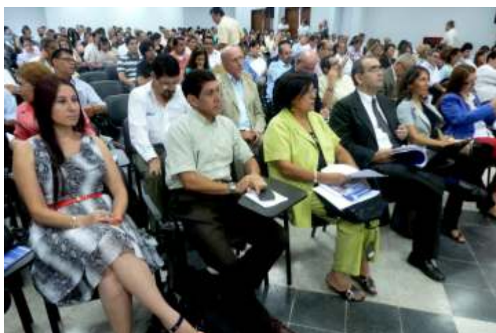
El cuerpo docente de la FP-UNA durante la reunión en el Aula Magna.