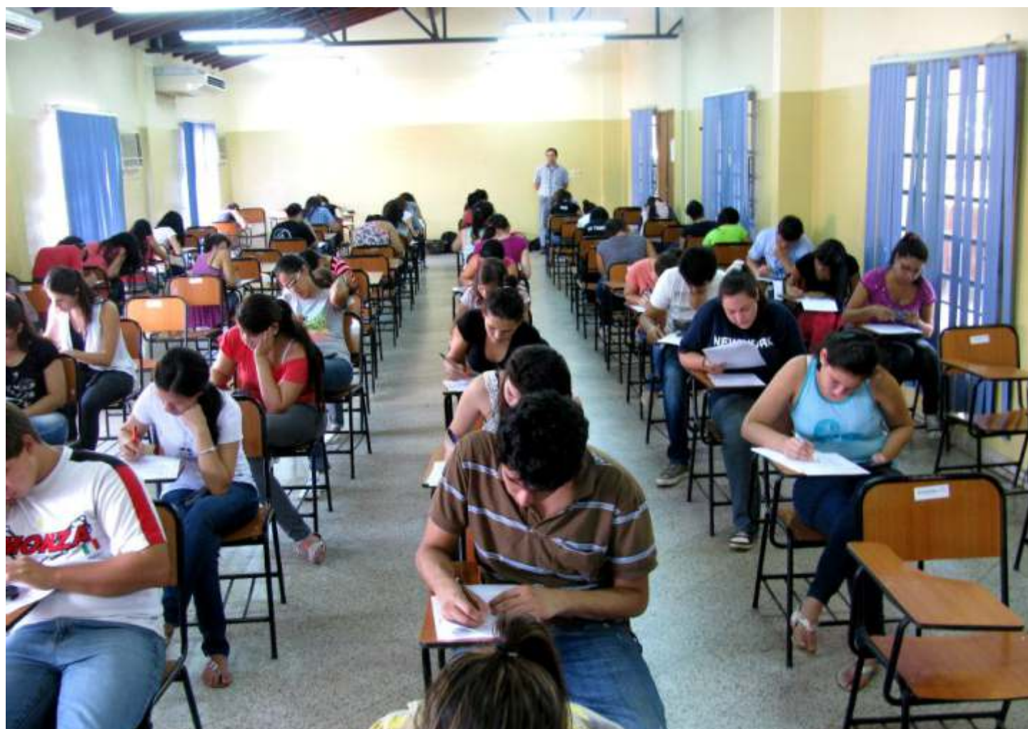
Instantánea a un grupo de estudiantes durante uno de los exámenes finales de admisión en la FP-UNA - Periodo 2013