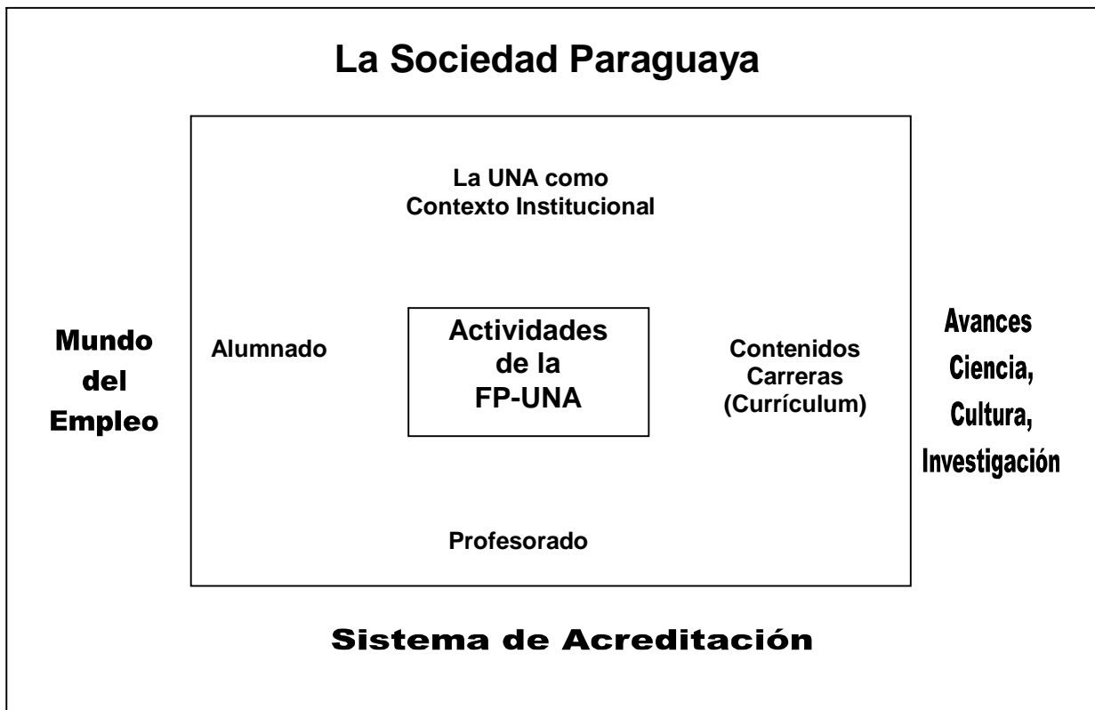
Gráfico 1. La Facultad Politécnica y su contexto

En los últimos 15 años, en estos 4 ejes se han producido cambios que generan presión, exigencia y condicionamientos a la Institución.