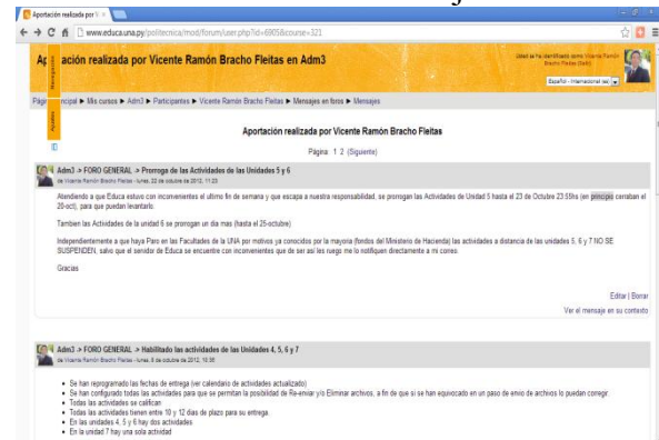
Figura 7: Foro General

Otra herramienta de comunicación asincrónica es el foro de debate. Tanto el tutor virtual como los estudiantes pueden enviar mensajes al foro para realizar consultas, aclarar dudas que, o bien van dirigidas a cualquier persona en general del curso que lea el mensaje, profesores, tutores virtuales, resto de los compañeros, etc., o bien se puede especificar en el mensaje a quién/es va dirigida la pregunta o consulta efectuada. Constituyen el entorno ideal para la participación en las actividades de trabajo, para la realización de actividades de aprendizaje colaborativo en las que cada uno expone sus ideas, opina, critica o escucha las aportaciones de los demás. Este y todos los foros se encuentran asociados a una cuenta de correo tal como lo está la herramienta anterior “la mensajería”.