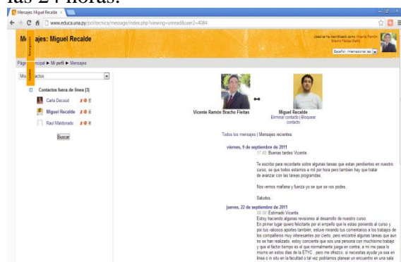
Figura 6: Mensajería

Entre las primeras destaca la Mensajería, que es una herramienta que trae incorporado la plataforma virtual Educa (moodle) y que configurado correctamente lo podemos asociar a un correo electrónico y que a su vez hoy en día también lo podemos asociar a un Smartphone o teléfono inteligente, lo que permite que el profesor responsable de la cátedra y/o tutor virtual, reciba de forma inmediata una copia del mensaje enviado a la plataforma virtual directamente al correo electrónico asociado al teléfono inteligente o una tableta digital. El correo electrónico es una pieza fundamental para lograr el aprendizaje de forma satisfactoria para alumnos y formadores, permitiendo al tutor virtual llevar a cabo un control de calidad de todo el proceso. Una de las principales necesidades de los alumnos para abordar un proceso formativo a distancia es la motivación, como en cualquier proyecto que se emprende el nivel de motivación inicial suele ser elevado dado que las expectativas del alumno referentes a la materia y a la metodología son altas. Se han de considerar algunos aspectos importantes para que las tutorías se realicen con éxito. La contestación a las dudas y cuestiones de los alumnos debe realizarse lo antes posible. El retraso en la recepción y envío es una actitud poco educada hacia los demás interlocutores y puede hacer que algún mensaje importante no cumpla su función comunicativa a tiempo. El plazo máximo de respuesta no debería sobrepasar las 24 horas.