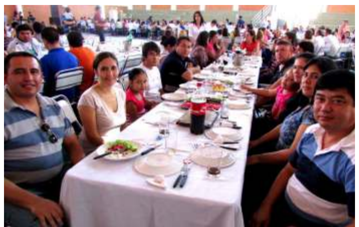
Instantánea de una de las mesas durante el Almuerzo de Confraternidad en el Polideportivo de la FP-UNA.