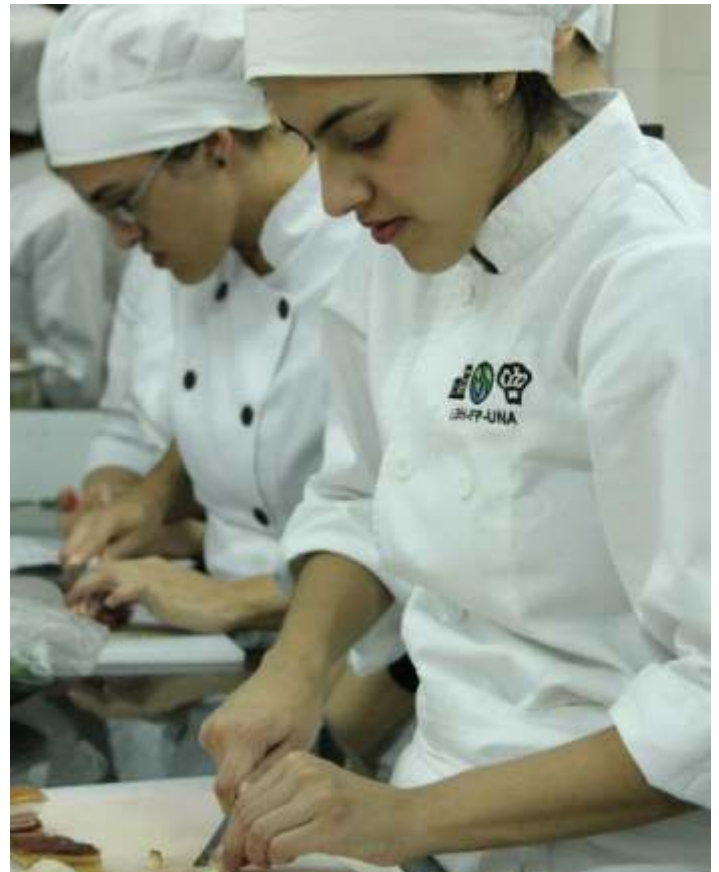
Instantáneas de los estudiantes de la carrera de Licenciatura en Gestión de la Hospitalidad durante el desarrollo de la clase de Gastronomía I.