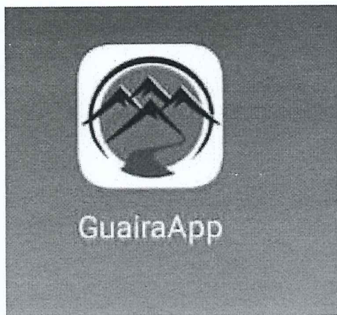
Imagen de GuairAPP